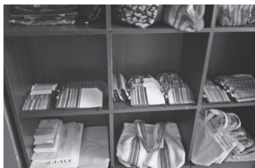
フィリピン、ランパラハウスの縫製品

このようなやり方は、バートーファンでのインタビューにも見られるように、工場での時間制限の厳しい仕事のやり方と職人肌気質で丁寧にゆっくり仕上げるやり方として対