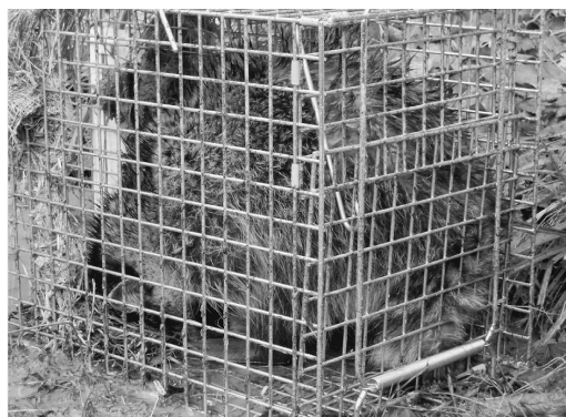
図2 文四郎池でのスイレンの繁茂(上)と、文四郎池で捕獲されたアライグマ(下)

ヶ所存在している 2) 。そのうち48ヶ所については、土山らが2004年から2007年までに調査した水質の報告 3) があるものの、文四郎池で行われた水質調査は1982年の報告 4) のみであり、それも1963年以来行われてきた学生実習で任意に採水したものの一つとして結果が示されているに過ぎず、文四郎池での採水年次や調査回数などの詳細については不明である。