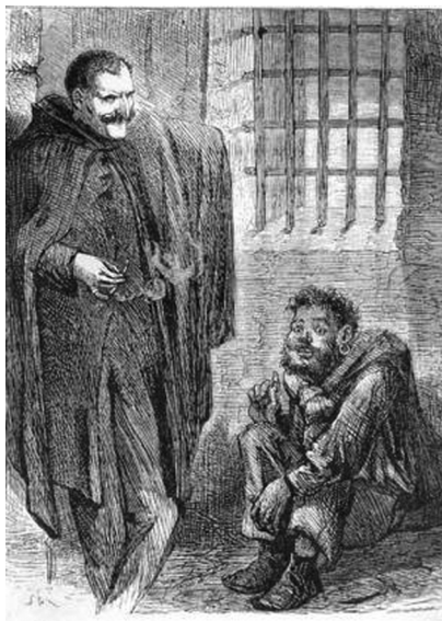
【図版2】“Rigaud and Cavalletto” by Sol Eytinge 1871, Wood engraving. Second full-page illustration in the Ticknor and Fields (Boston, 1871)

挿絵の右側に位置する小さな男、ジョン・バプティスト・カヴァレットは、貧しいながらも陽気なイタリア人の船乗りで、マルセイ